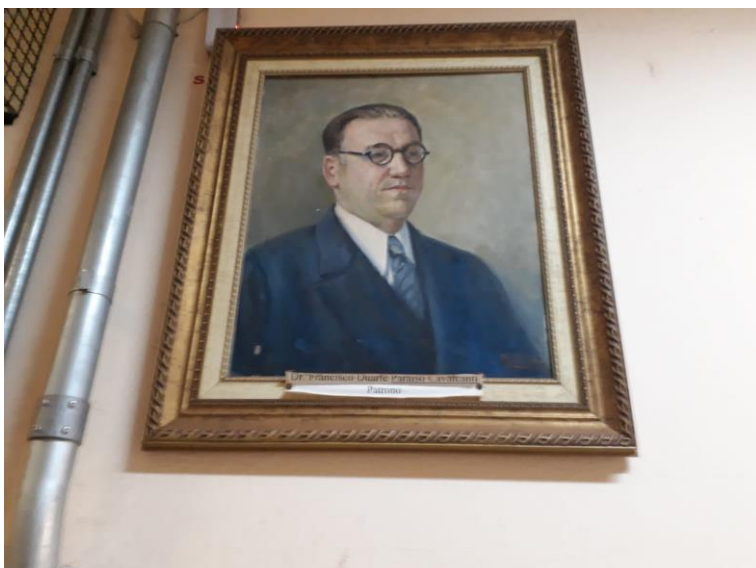
Figura 4. Quadro com pintura do retrato do Patrono da Escola: Doutor Paraíso Cavalcanti