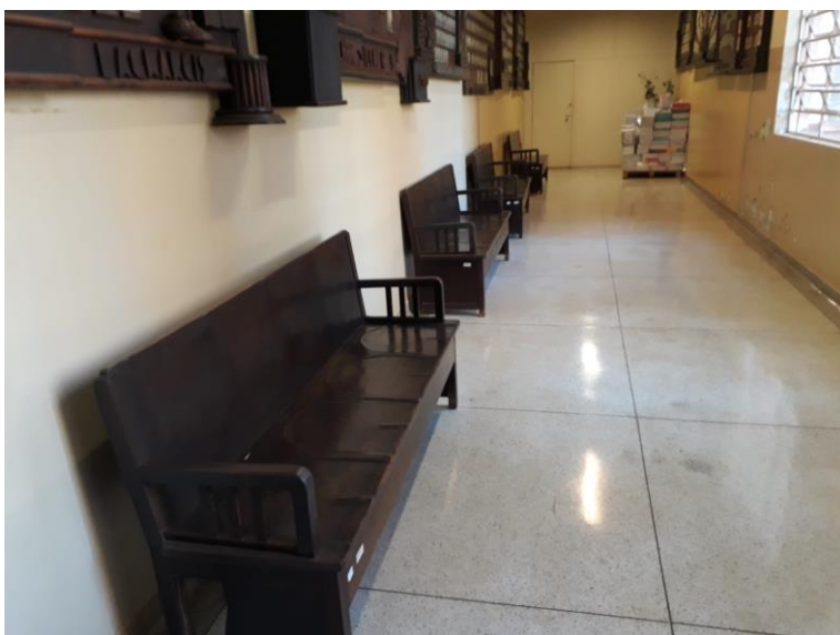
Figura 8. Bancos de madeira no corredor que abarcar vários quadros de fotografias de ex-alunos.