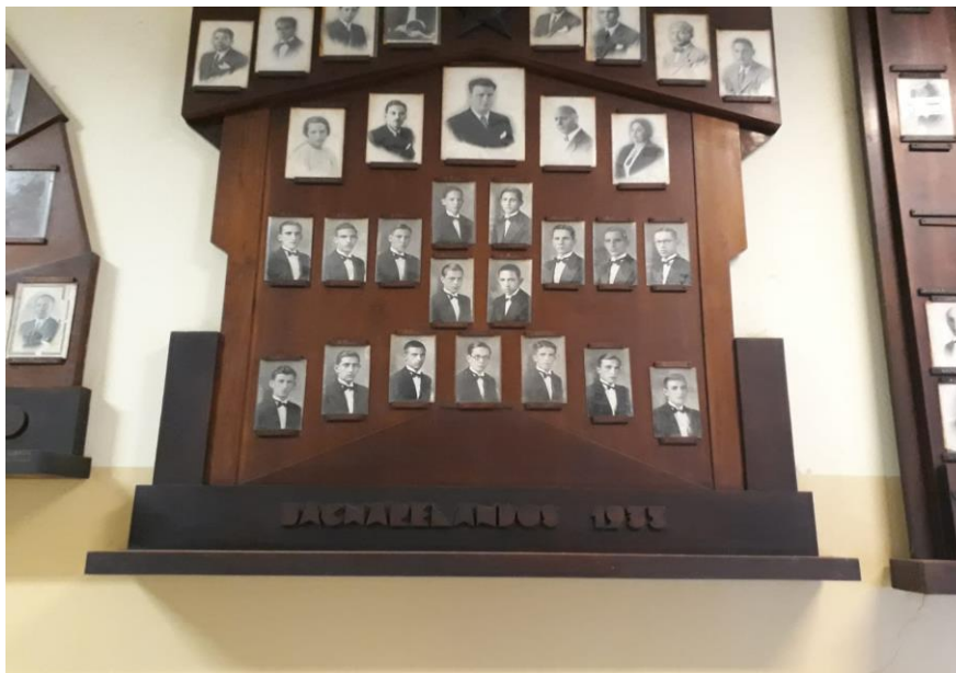
Figura 1. Quadro com fotografias dos formandos de 1933

história da escola estão registrados de alguma forma nas fontes históricas espalhadas pelos espaços fora da sala de aula, conforme fotos abaixo: