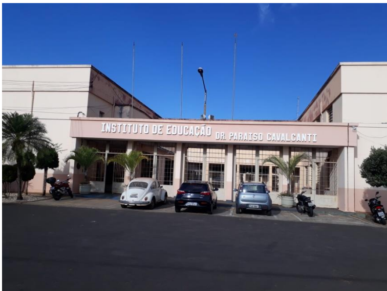
Figura 5. Fachada de entrada da escola Paraíso Cavalcanti - Ainda com a denominação de Instituto de Educação