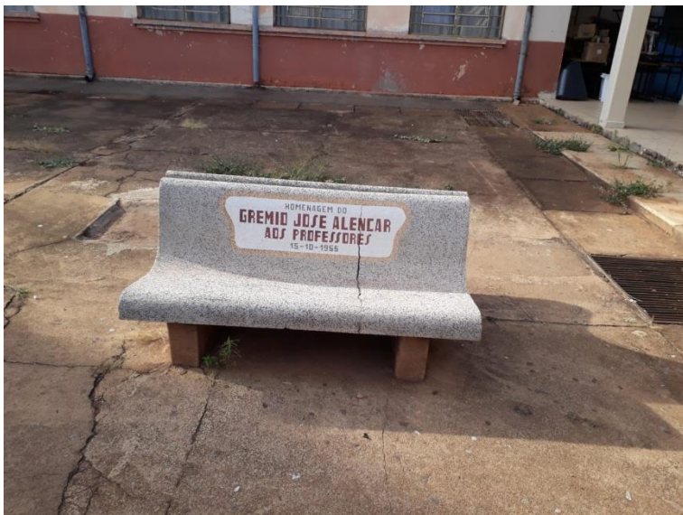
Figura 7. Banco para descanso no pátio da escola, homenagem dos alunos do grêmio aos professores, datada de 15 de outubro de 1955.