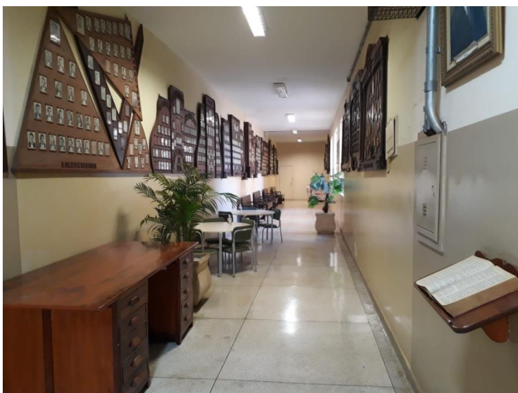
Figura 10. Mais uma foto do corredor com quadros de ex-alunos com escrivaninha bem antiga.

Muitas outras imagens e espaços podem ser explorados pelos alunos no ambiente escolar da EE Doutor Paraíso Cavalcanti. Aqui é apenas uma pequena amostra do que há de interessante e explorável historicamente na escola.