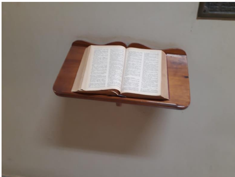
Figura 3. Porta bíblia com uma bíblia antiga exposta