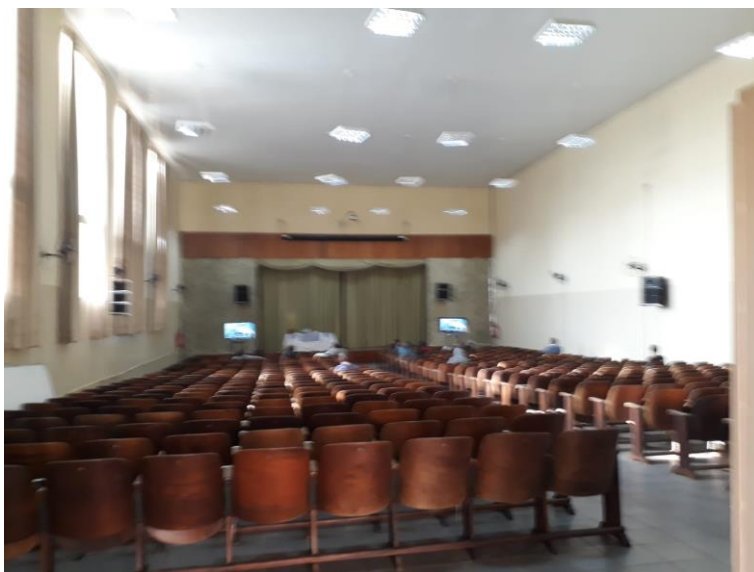
Figura 9. Auditório, com capacidade para quase quinhentos expectadores, com palco, coxia, bastidores e quadro para projeção