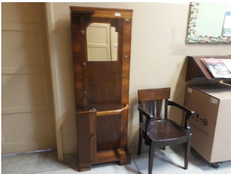
Figura 2. Chapeleiro com porta guarda-chuvas e cadeira de descanso