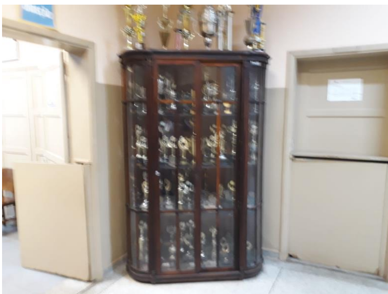
Figura 6. Armário com várias taças esportivas de vários anos