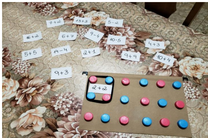
Figura 2: Tecnologia Assistiva Deficiente Visual