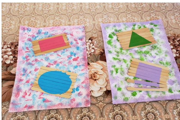
Figura 3: Tecnologia Assistiva Deficiência Intelectual

A figura 2, é uma tecnologia que tem o intuito de facilitar contas simples, como adição e subtração, para as crianças com deficiência visual. Fazendo os resultados das contas em alto relevo (tampinha de garrafa) e circulando com um elástico.