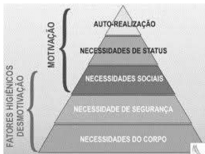
Figura 1 - Pirâmide necessidades

O psicólogo humanista Abraham Maslow (1908-1970) propõe em sua teoria - Teoria da Hierarquia das Necessidades Humanas - que possuímos uma escala de necessidades a serem supridas para que alcancemos a realização pessoal, a mais alta necessidade ambicionada pelos indivíduos. Segundo Silva (2012 apud CHIAVENATO, 2000) o criador dessa teoria organizou as necessidades humanas em níveis hierárquicos de acordo com a sua importância e influência, então, nas camadas bases estão as primordialidades mais simples e fáceis de serem conquistadas, como as fisiológicas - comer, dormir, vestir- e na mais elevada encontra-se a auto-realização do potencial de cada sujeito, mostrando assim, a mais difícil de ser alcançada. Dentre esses extremos, existem as essencialidades de segurança - emprego, saúde, família - e conseqüentemente as sociais, no qual abrange os vínculos afetivos construídos a partir de interações com os outros, por exemplo troca de amizade e relacionamentos amorosos. Entretanto, é importante salientar que as necessidades humanas não ocorrem em uma seqüência ordenada, pois todas estão presentes durante o desenvolvimento do ser humano, permitindo assim, a alternância de prioridades conforme o padrão de vida do indivíduo. (KONDO, 1997). Apesar disso, a pirâmide dispõe-se assim: