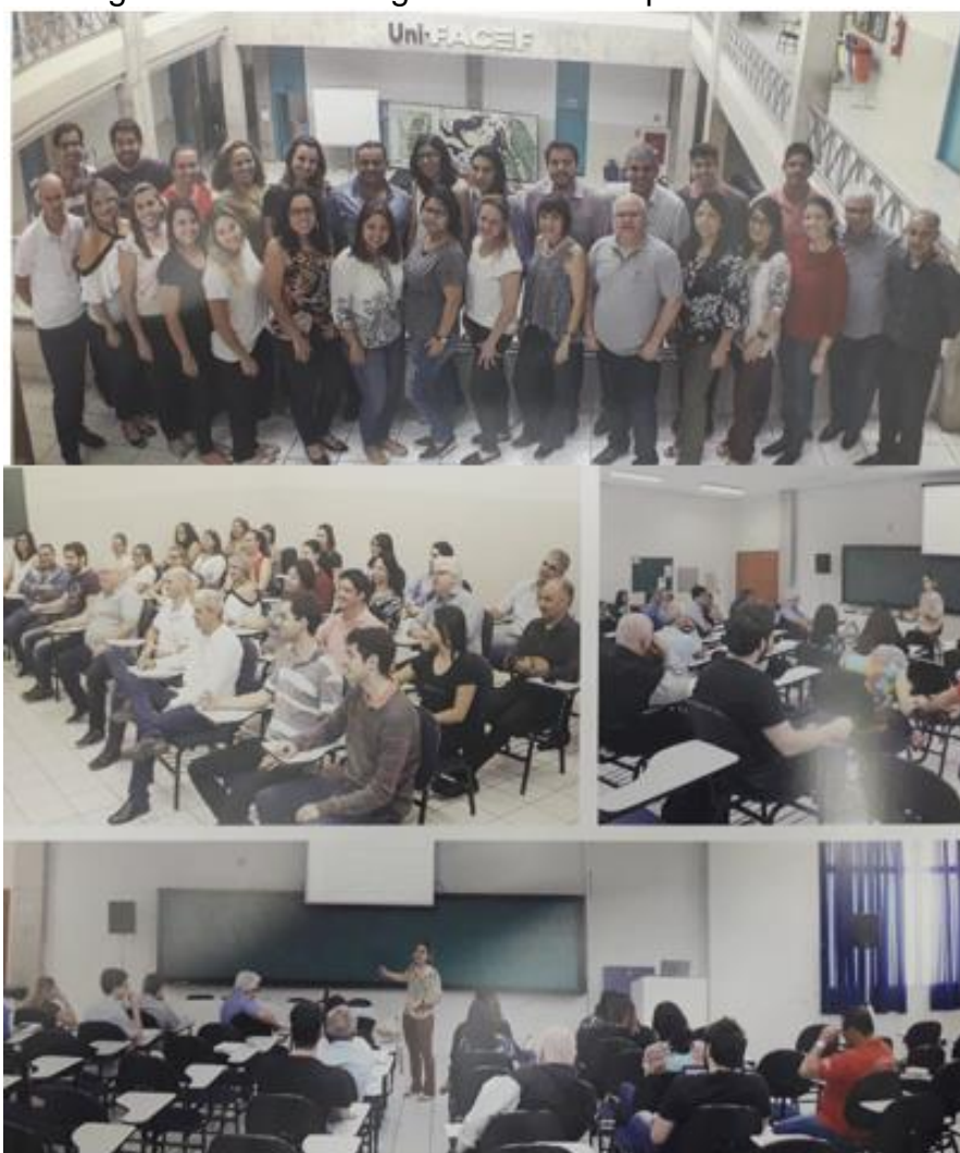
Figura 3 – Imagens do networking dos alunos da primeira turma do PDE-EPN

Fonte: EPN, 2019. Adaptado pelos autores.