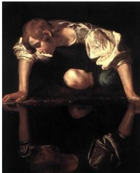
Figura 1 - Narciso, Caravaggio, 1597, Galleria Nazionale d'Arte Antica – Palazzo Barberini, Roma.