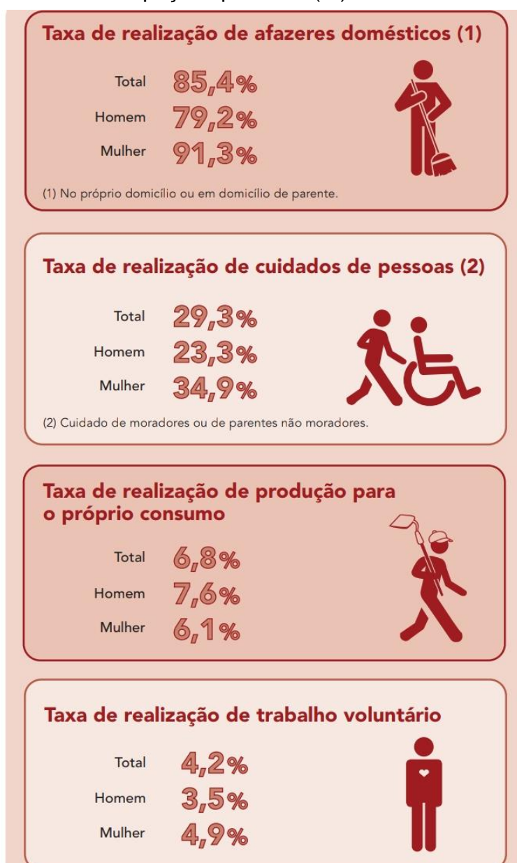
Figura 2 – Diferentes ocupações por sexo (%)